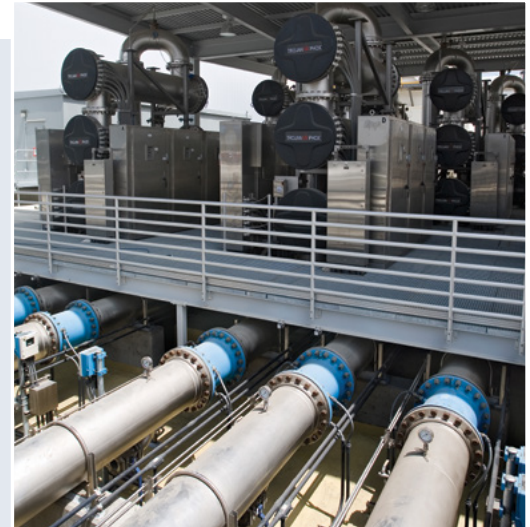
Figura 1 El TrojanUVPhox en el GWRS

El desempeño del TrojanUVPhox ha superado los requisitos de tratamiento de la División de Agua Potable de California. Tal como se ilustra en la Figura 2 , el sistema reduce de forma efectiva el NDMA por debajo del nivel de notificación de tratamiento de 10 ppt establecido por DDW.