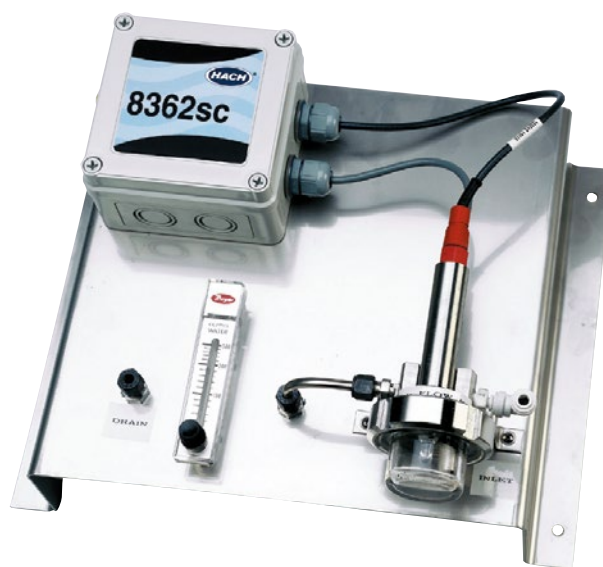
Figure 1 – Panneau pH 8362 sc

La calibration initiale et continue des électrodes de pH est essentielle pour l'obtention de mesures précises. Les calibrations sont réalisées grâce à des solutions tampon préparées à des concentrations connues. Ces tampons ont une concentration ionique beaucoup plus élevée que l'eau ultra-pure du cycle de vapeur. Cette différence significative de concentration rend la calibration d'une électrode à faible concentration ionique fastidieuse. L'électrode doit être équilibrée avec les tampons à haute concentration ionique pour la calibration, puis rééquilibrée avec l'eau de traitement à faible concentration ionique. L'ASTM D5128 recommande