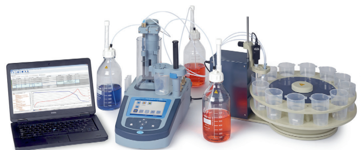
Configuración del sistema que incluye el valorador AT1000 y el cambiador de muestras AS1000

Las soluciones de automatización multiparamétricas del cambiador de muestras AS1000 liberan al operador de análisis tediosos y repetitivos y le permiten centrarse en tareas más valiosas que no se pueden automatizar.