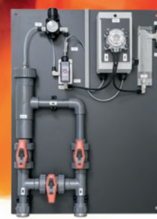
Pannello di pretrattamento dei campioni