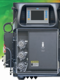
Analizzatore a chemiluminescenza