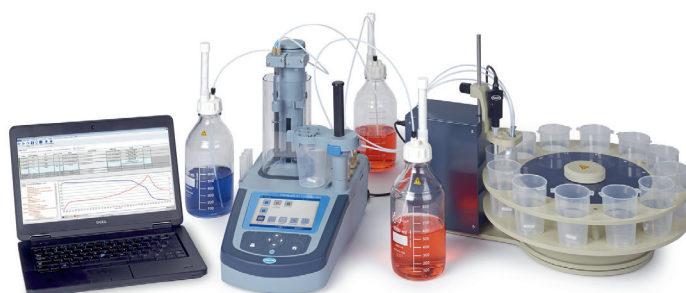
Exemple de configuration avec titrateur AT1000 et passeur d'échantillons AS1000

Les solutions d'automatisation multi-paramètres des passeurs d'échantillons AS1000 permettent aux opérateurs de gagner du temps sur les analyses fastidieuses et répétitives pour se consacrer à des tâches plus importantes qui ne peuvent pas être automatisées.