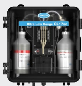
Αναλυτής CL17sc Ultra Low Range με κιτ εγκατάστασης ρυθμιστή πίεσης PN9790300