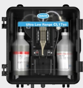
Αναλυτής CL17sc Ultra Low Range με κιτ εγκατάστασης σωλήνα-ορθοστάτη PN9790200